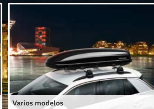
BAÚLES DE TECHO