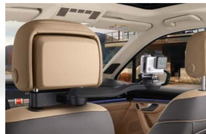
SOPORTE PARA CÁMARA