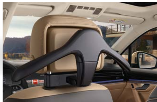
PERCHA PARA ROPA