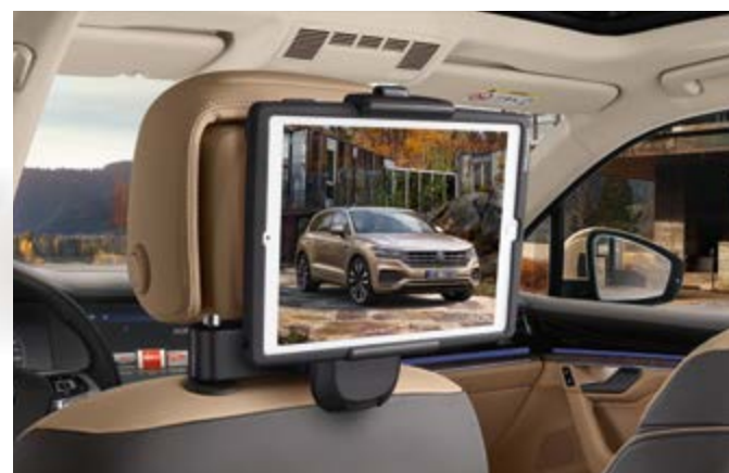
SOPORTE PARA DISPOSITIVOS

Nota: Consulta la información completa de estos productos en la página 42.