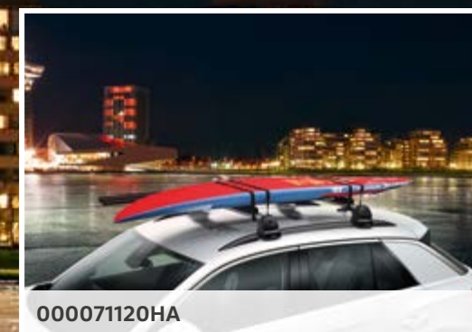
PORTATABLAS DE SURF