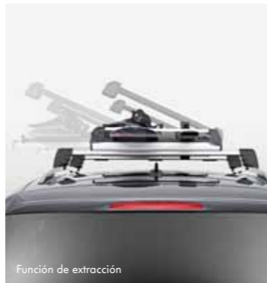
Función de extracción