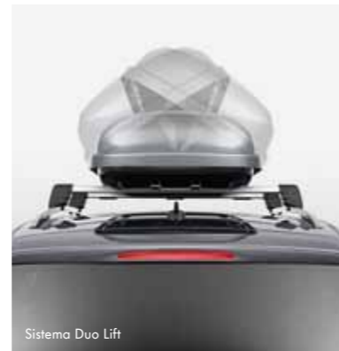
Sistema Duo Lift

Este símbolo representa tu seguridad. Más exactamente, significa que tu sistema de transporte ha sido comprobado meticulosamente. El auténtico símbolo de tu seguridad. La prueba City Crash simula una colisión habitual por alcance a aproximadamente 30 km/h. Si el sistema de transporte, que ha sido preparado de forma realista, sigue en su lugar, significa que ha superado la prueba y que es fiable en cuanto a seguridad.