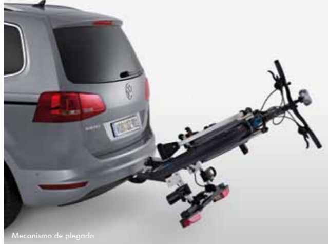
Mecanismo de plegado

ART. N.º 3C0 071 105 B PORTABICICLETAS COMPACT II, PARA 2 BICICLETAS ART. N.º 3C0 071 105 C PORTABICICLETAS COMPACT III, PARA 3 BICICLETAS (NO SE MUESTRA EN LAS IMÁGENES)